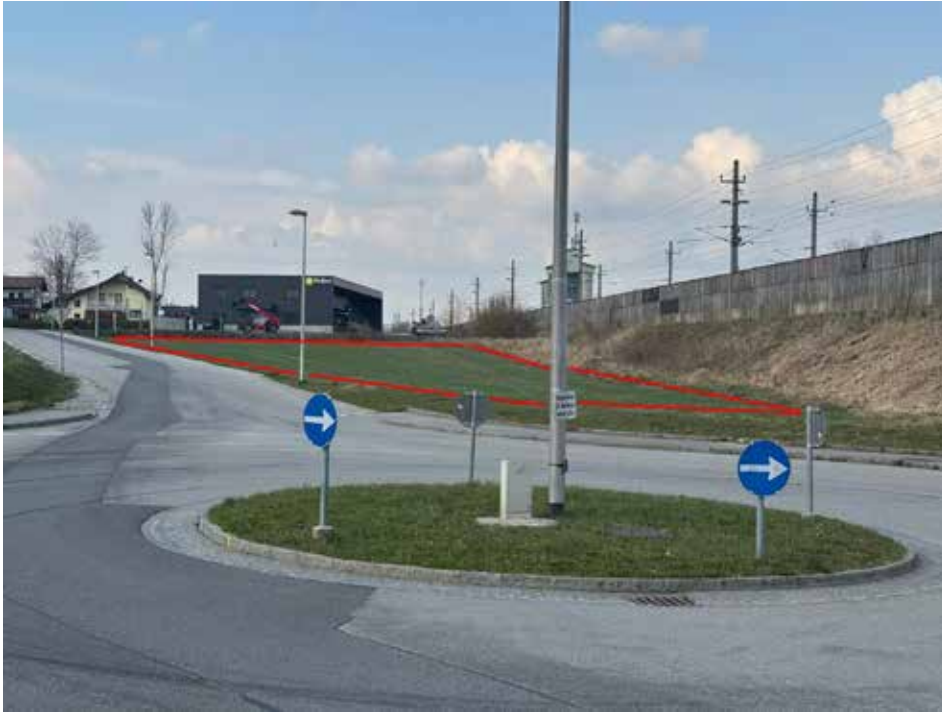
Geplantes Grundstück für Neubau der Firma KARL AutomatenService

Die Firma AutomatenService KARL plant, ihren derzeitigen Standort in der Peßlerstraße 9 zu verlegen. Der aktuelle Standort ist nur angemietet, weshalb das Unternehmen nach einer langfristigen Lösung sucht.