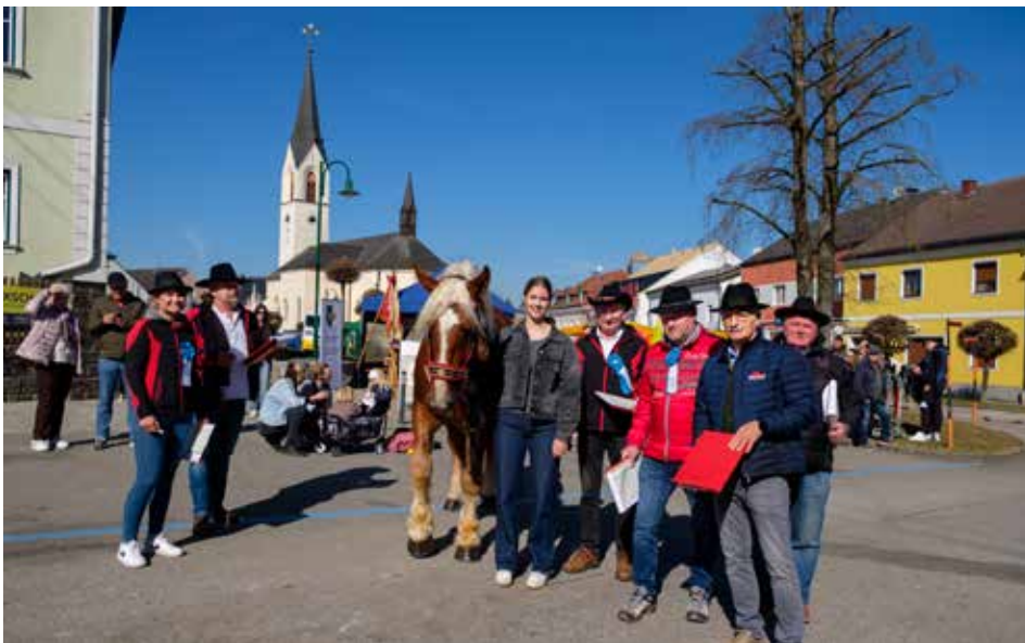
Die fachkundige Jury