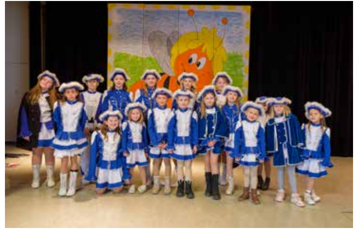
Riedauer Kinder- und Jugendgarde

Ein besonderer Höhepunkt war der mitreißende Auftritt der Riedauer Kinder- und Jugendgarde , die mit ihrer beeindruckenden Darbietung das Publikum begeisterte.