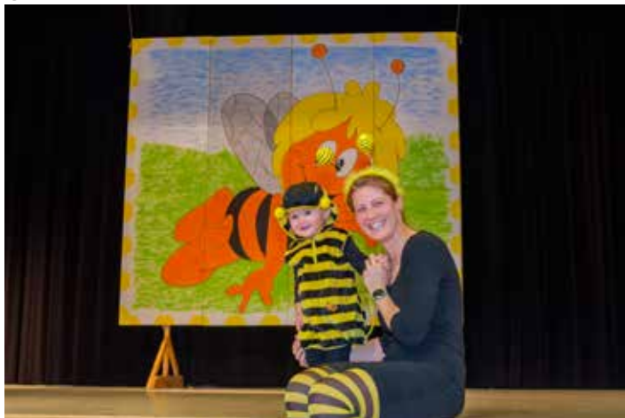
Bühnenbild - Biene Maja mit Gästen