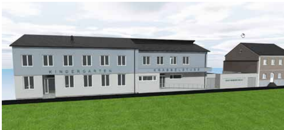
Symbolfoto Kindergarten-Krabbelstube nach Umbau