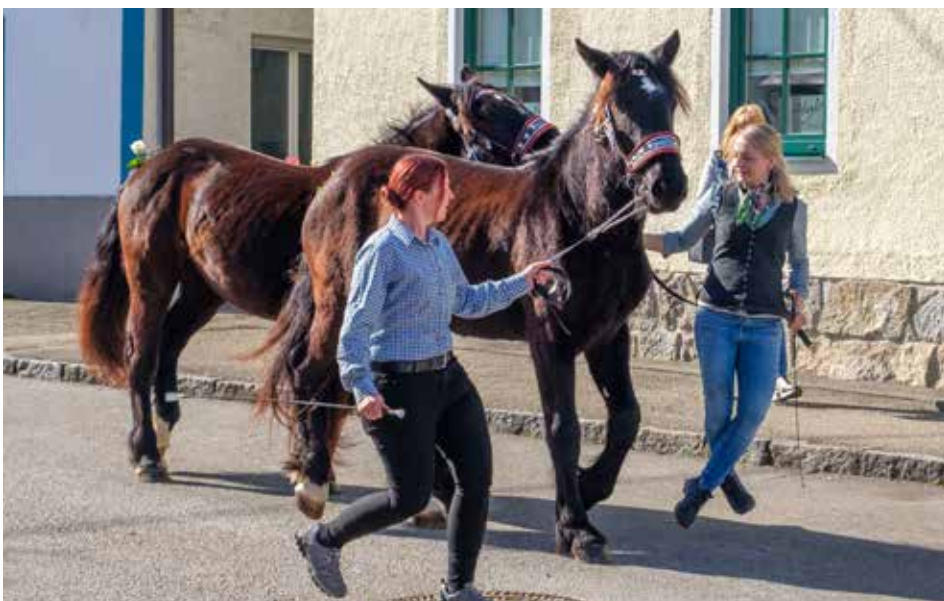
Die Pferdebesitzer beeindruckten die Jury mit Kunststücken